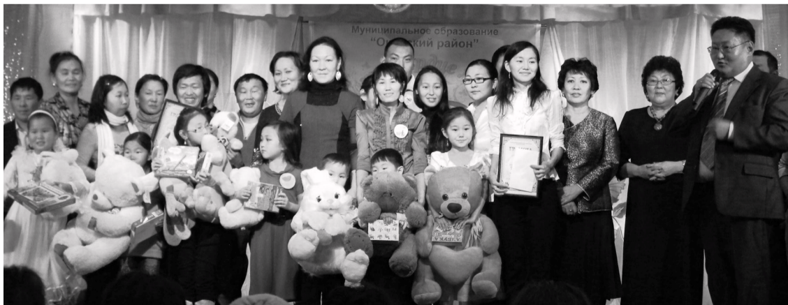
Эжынэртэ зорюулһан аймагай 7-дохи форумой хабаадагшад.