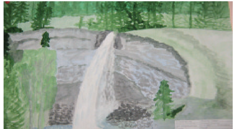
Рисунок «Водопад Сайлака» Шорноевой Хэиэгмы.

14 декабря 2012 г. был проведен районный заочный конкурс детских рисунков «Художники Бурятии», посвященный творчеству заслуженного художника РБ Ж.Ц. Раднаева.