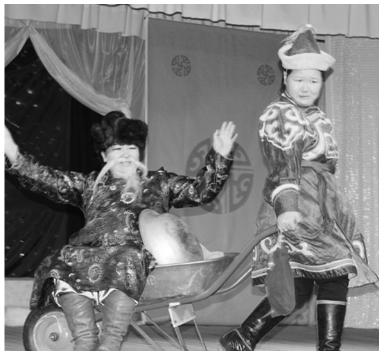
Ай да Будамиуу!

Но сам праздник на этом не закончился, ведь Сагаалган продлится в течение месяца. В это время принято потчевать гостей белой пищей, обмениваться подарками и добрыми пожеланиями, чествовать старшее поколение. Счастливого Белого месяца, дорогие земляки!