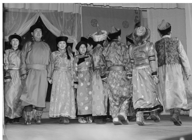
Коллектив Орликской школы исполняет ёохор