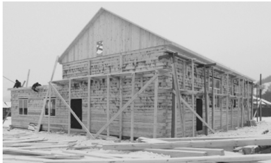
В 2014 году планируется завершение реконструкции здания КДЦ «Сылтыс»

превысил субсидии другим районам и составил более 6 млн. рублей. Эти средства будут направлены на завершение реконструкционных работ здания культурно-досугового центра «Сылтыс» в у. Сорок, уже начатых в прошлом году. Напомним, в 2013 году на ремонт здания сельского клуба затрачено около 4 млн. рублей.