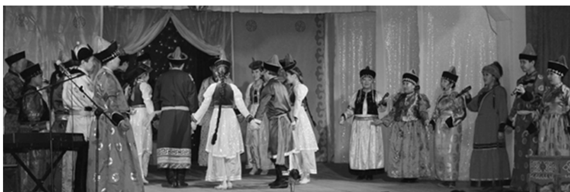
Сводный молодежный ансамбль

По результатам конкурса высокопрофессиональным жюри было принято решение не определять призовые места и вручить грамоты за активное участие с денежной премией