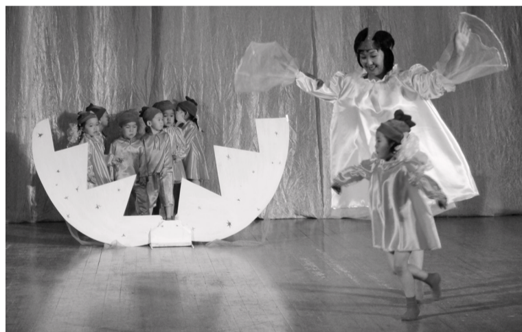
Танец «Дружная семейка»